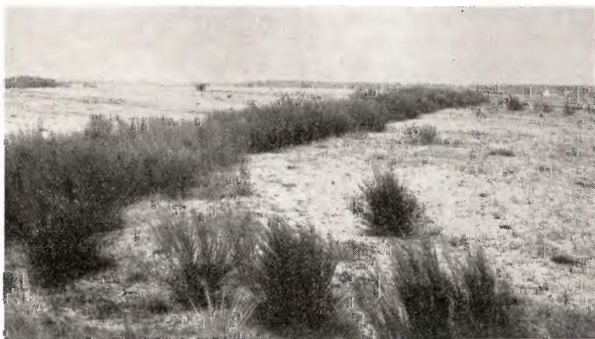
Enkelt stribe i Grarup-lejet, set mod nord. Plantet og sået oktober 1949. Fot. 1951.

I de lejer, hvor gyvelen har haft godt vækstbetingelser fremtræder stri-