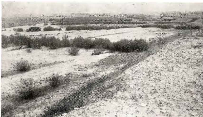
Parti fra Grarup-lejet, set mod øst. Plantet og sået oktober 1949. Fot. 1951.

1952—53 må der ventes nogen nedgang, da de resterende lejer ligger mere spredt.