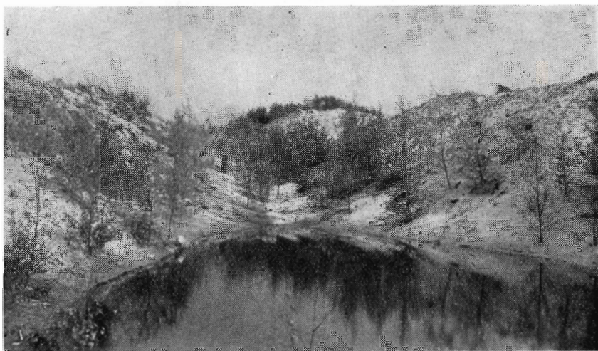
Gejlbjerg-lejet. Birk, plantet 1949, fot. 1951.

berne efter få års forløb som en række hurdler, så man næsten fristes til at starte et hækkeløb. Billederne fra Grarup-lejet er fotograferet den 28. september 1951, to år efter plantning og såning, samtidig foretoges en bedømmelse af resultatet. Gyvelen fik karakteren mg, medens fyrrene kun opnåede g. En del af fyrrene var gået ud, inden gyvelen var kommen frem, men de resterende planter stod godt inde mellem gyvelen.