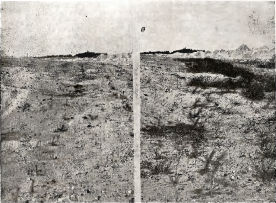
Til venstre stribe i Resen-lejet, plantet 1949, fot. 1950.