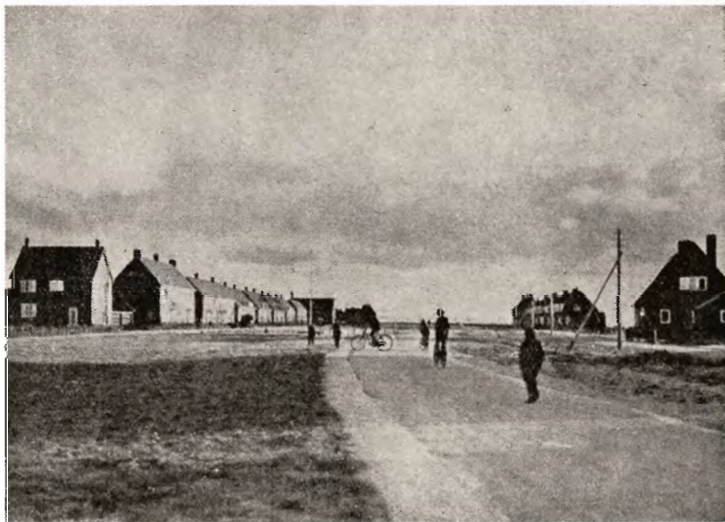
Landsbyen Slootdorp i Zuiderse-Arealet. Endnu har det ikke været muligt at faa Træer til at gro.

Ogsaa det har Hollænderne taget fat paa med den samme Iver. Hvor Pengene kommer fra, kan jeg ikke udtale mig om, men jeg saa et Eksempel paa, hvorledes man havde skaffet sig billig Arbejdskraft. Det var i det nordøstligste Hjørne af Provinsen Groningen ved Emsflodens Munding. Her finder fra gammel Tid en betydelig Slikaflejring Sted paa Forlandet; de opgroede Arealer er fra Tid til anden blevet inddiget, saaledes at der nu findes 7—8 inddigede Arealer, det ene uden for det andet, og yderst paa For-