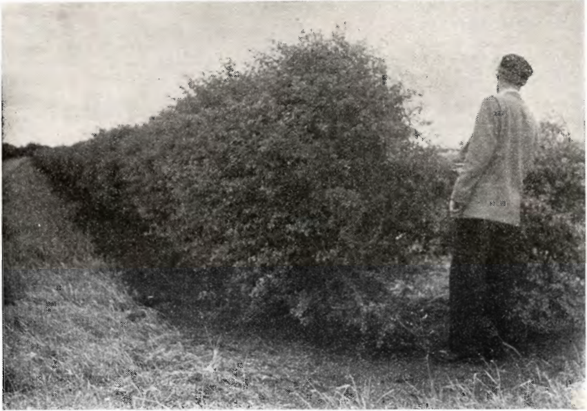
fol. H. S.

I Sønderjylland i nærheden af Bevtoft har tidsskriftets fotograf haft lejlighed til at tage hosstående 2 billeder, der viser 2 tjørnehegn, plantet for 6 år siden i fortsættelse af hinanden af Det flyvende