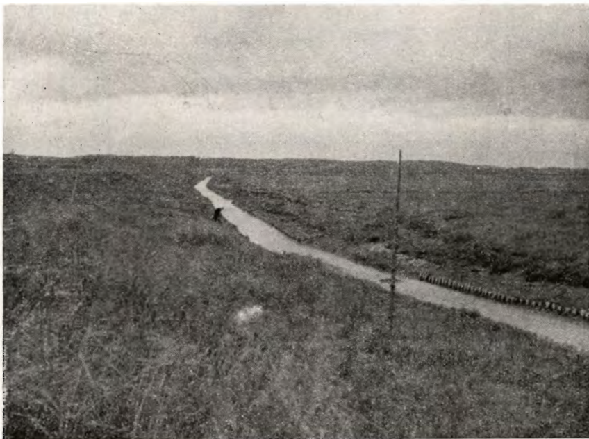
Udsigt fra diget ved pumpehuset i Hollandsbjerg-Bode-Stenalt enge. Man ser samlekanalen, der går indenfor diget mod nordvest med Grund fjord på den anden side diget.

Da tilsvarende betingelser, som i Hollandsbjerg-sagen var anvendt ved en række andre landvindingssager, havde afgørelsen betydning udover denne sag, hvor erstatningskravet var af størrelsesordenen ca. 125 000 kr. Den 3. oktober 1945 afsagde voldgiftsretten kendelsen, der frifandt bygherren for entreprenørens krav.