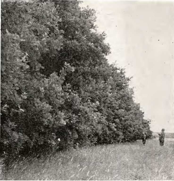
fol. H. S.

umuligt at tage et tilsvarende billede, idet marken foran er tilplantet med rødgran, men derfor mister egerækken ikke sin værdi for plantagen, idet den fortsat vil have betydning for plantagen, f. eks. ved brand, ved stormfald, ved bladefaldet o. s. v.