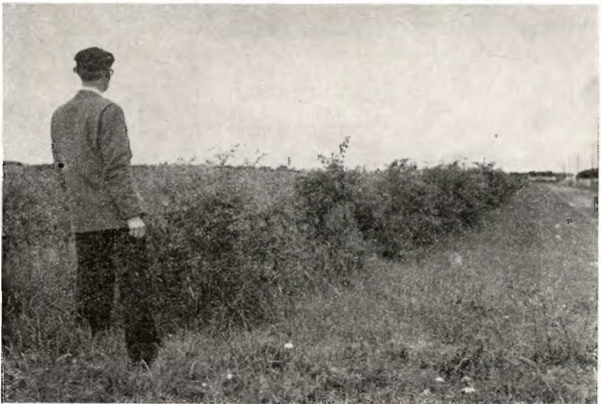
fol. H. S.