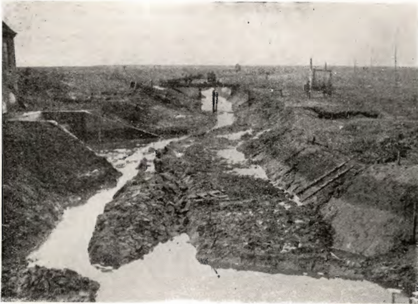
Et billede, der viser vanskelighederne under arbejdets udførelse i Hollandsbjerg enge. Den store samlekanal ved indløbet til pumpehuset er skredet ud, og udskridningen, der er ved at blive bragt i orden, har næsten lukket kanalen og forskubbet jordlagene langt ind på engen.