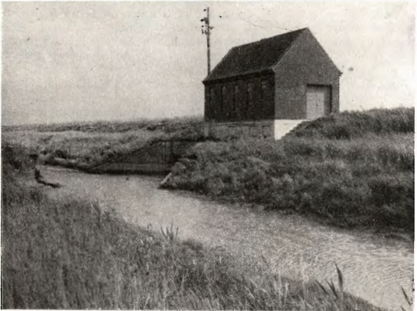
Det store pumpehus i Hollandsbjerg-Bode-Stenalt enge. I bygningen er der 2 sæt automatisk elektriske pumper og samtidig indrettet transformatorstation. I forgrunden ses samlekanalens tilløb til pumperne.

Undergrunden, hvor diget skulle placeres, består af dynd til stor dybde. Der skete derfor under arbejdets udførelse flere steder i kanalen (fyldgraven) langs fjorddiget udskridninger af siderne og opskydninger i bunden samtidig med sætninger i diget. Entreprenørerne mente sig berettiget til ekstrabetaling for optagning af disse skred, og da man fra bygherrens