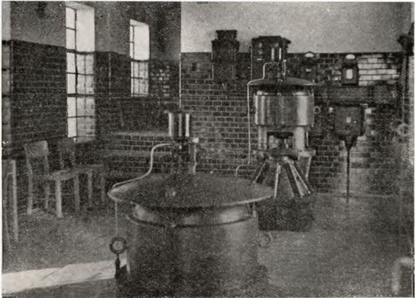
Fra det indre af pumpehuset i Hollandsbjerg enge.